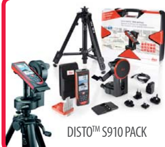
DISTO™ S910 PACK