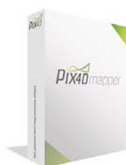
Pix4Dmapper 1 mese